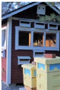
Farfars paviljong används idag mest till bireddskap. Istället får bina bo i lätta frigolitlådor, vilket underlättar vid alla lyft som måste göras, speciellt vid ekologiska metoder.