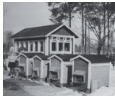
Farfar snickrade både bipaviljong och trågbupor. Här en bild på bigården från 40-talet.